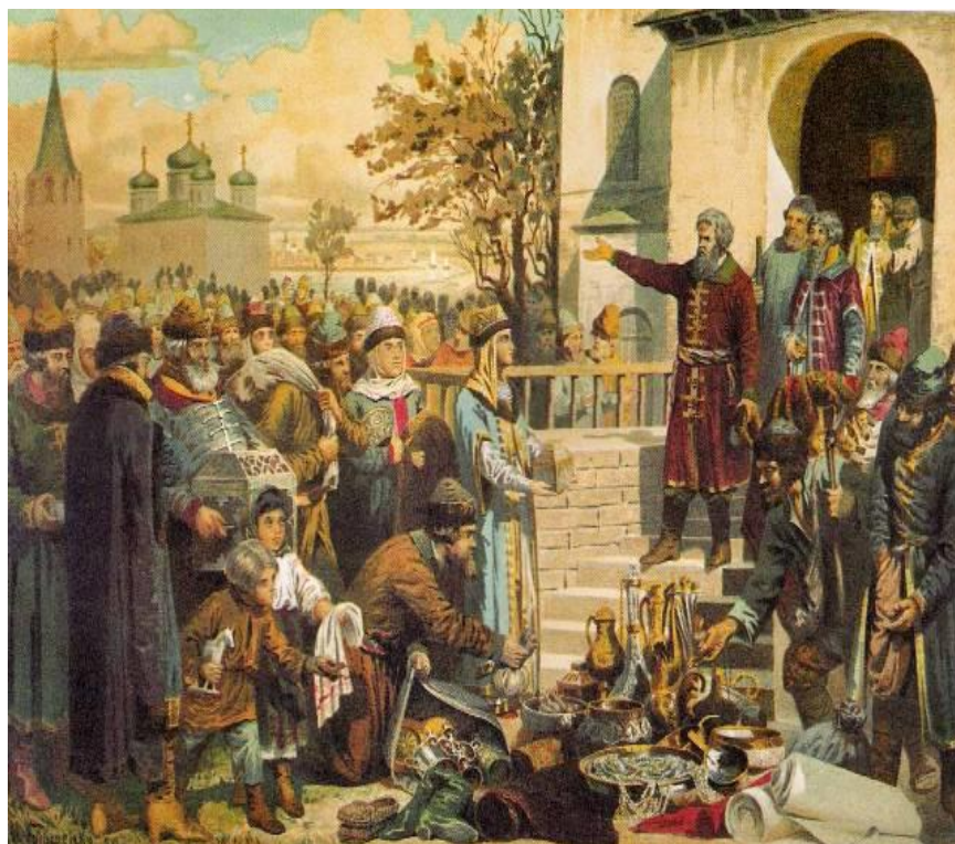
А.Кившенко «Воззвание Минина»

Собрать деньги на рать важно, но это ещё не главное. Главное – найти воинов в войско и полководца достойного. Остановили свой выбор нижегородцы на князе Дмитрие Пожарском – о нём по Руси шла добрая слава. Согласился князь возглавить войско.